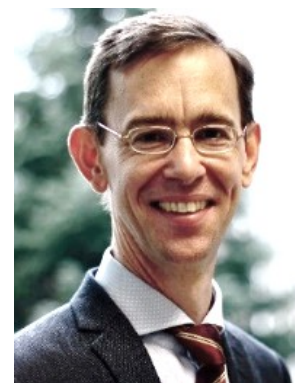
Prof. Dr. Karl Riesenhuber Stellvertr. Vorsitzender